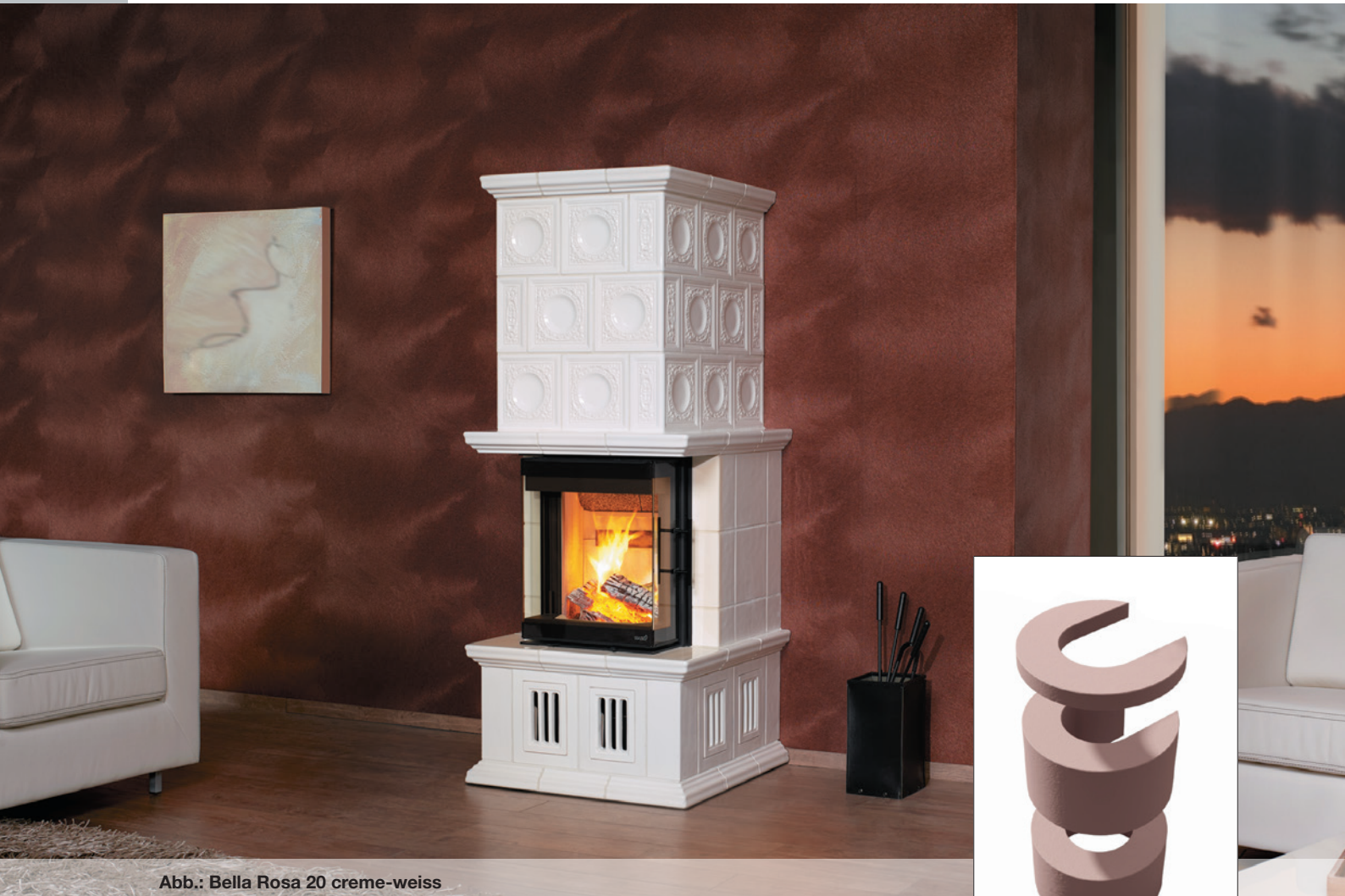
Abb.: Bella Rosa 20 creme-weiss

GmbH & Co. KG HARK ® Die 1 Nr. 1 im Kamin- und Kachelofenbau